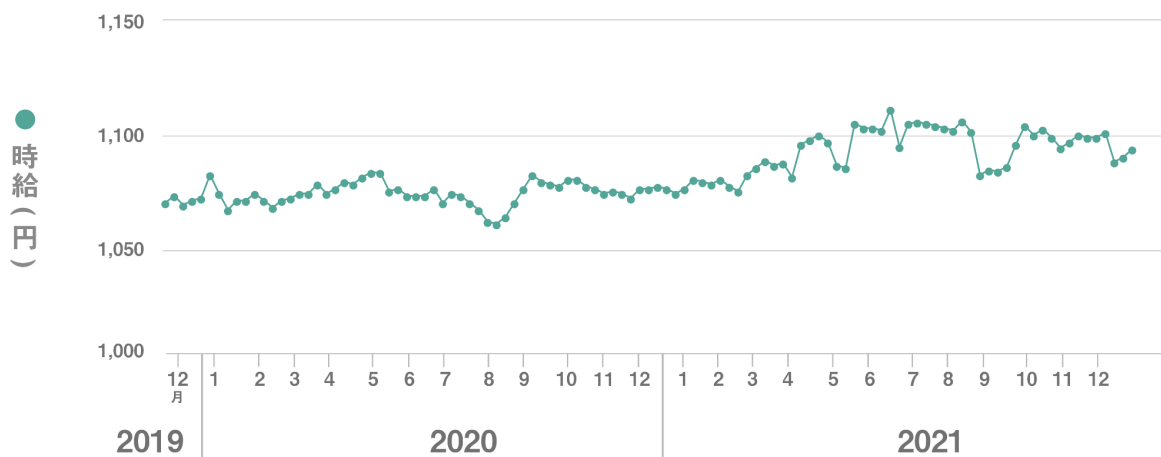
【図1】全国平均時給 直近25か月の推移

■12月度の全国アルバイト・パート求人数は、679,863件(前月比-8,112件、前年同月比+150,372件)で前月から1.2%減少、前年同月から28.4%増加した。【図2】