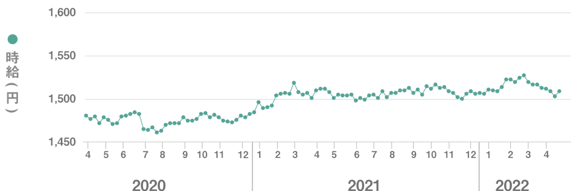
【図1】 全国平均時給 直近25か月の推移

■4月度の全国派遣求人数は309,321件（前月比-45,386件、前年同月比+106,491件）で前月から12.8%減少、前年同月から52.5%増加した。【図2】