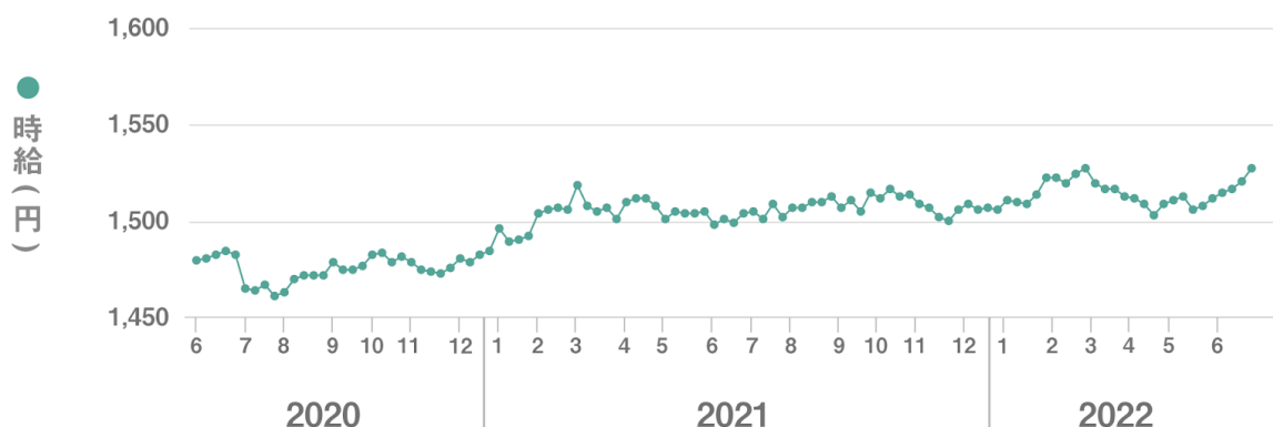
【図1】 全国平均時給 直近25か月の推移

■6月度の全国派遣求人数は304,429件（前月比-11,560件、前年同月比+92,658件）で前月から3.7%減少、前年同月から43.8%増加した。【図2】