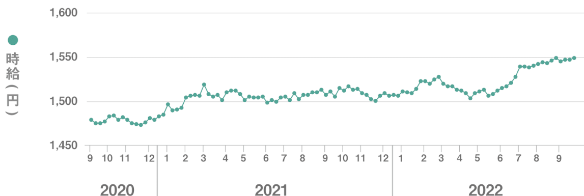
【図1】 全国平均時給 直近25か月の推移

■9月度の全国派遣求人数は335,261件（前月比+18,409件、前年同月比+83,175件）で前月から5.8%増加、前年同月から33.0%増加した。【図2】