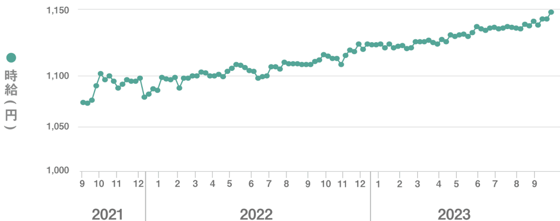
【図1】 全国平均時給 直近25か月の推移

■9月度の全国アルバイト・パート求人数は1,040,465件（前月比+9,612件、前年同月比 +154,669件）で前月から0.9%増加、前年同月から17.5%増加した。【図2】