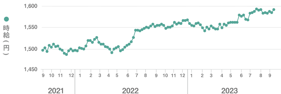
【図1】 全国平均時給 直近25か月の推移

■9月度の全国派遣求人数は367,400件（前月比+5,975件、前年同月比+32,139件）で前月から1.7%増加、前年同月から9.6%増加した。【図2】