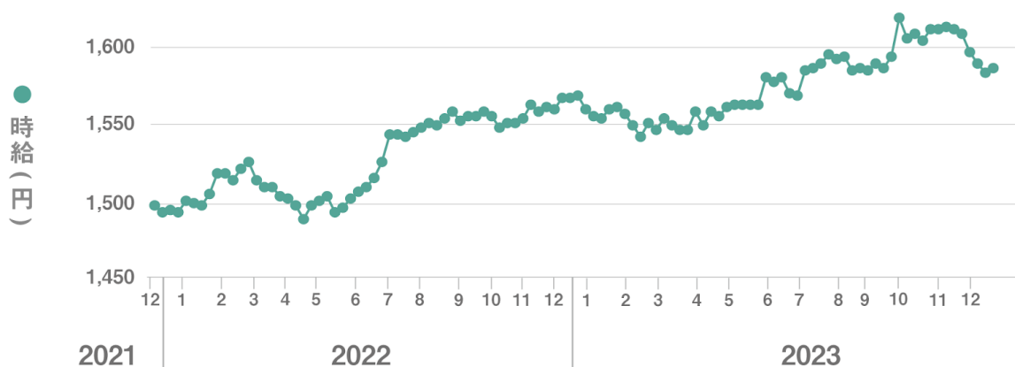
【図1】 全国平均時給 直近25か月の推移

■12月度の全国派遣求人数は327,817件（前月比-3,036件、前年同月比-28,399件）で前月から0.9%減少、前年同月から8.0%減少した。【図2】